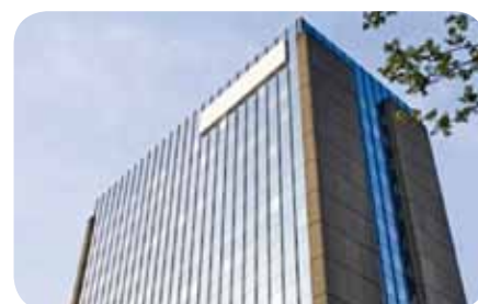
sds Firmensitz in Mülheim an der Ruhr