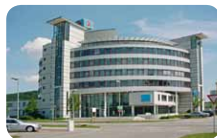
sds Niederlassung in Leonberg