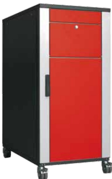
Leistungsstark und robust: Das sds Compact Center

Durch den Virtualisation Service der sds werden alle Ressourcen optimal genutzt und sind durch standardisierte Prozesse einfach zu warten. Softwareseitig werden unterschiedlichste Applikationen zentral bereitgestellt, was insbesondere eine einheitliche Versionierung der Programme und eine deutlich kostengünstigere Administration möglich macht. Automatische Lastverteilung und hohe Verfügbarkeit gewährleistet jederzeit Performance bei kontinuierlicher Stabilität. Und mit sds können Sie Applikationen als „Software as a Service“ (SaaS) nutzen: Sie benötigen nur noch eine minimale EDV-Infrastruktur für den Zugriff auf die bereitgestellte Software und erhalten von uns den gesamten Service.